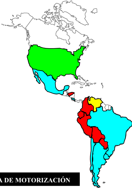
TASA DE MOTORIZACIÓN

DE MOTORIZACIÓN: IM = Índice de Motorización (Pondera el nivel de motorización en la sociedad. Población por Parque Automotor)