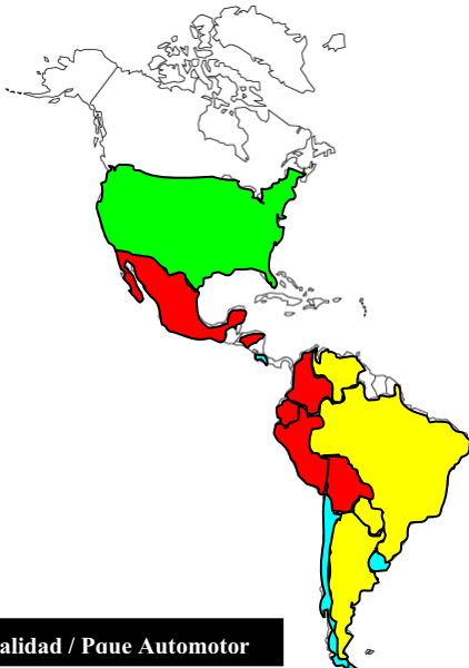
Mortalidad / Paue Automotor

IFV = Índice de Fallecimientos por Vehículos (Parque Automotor) por causa de accidentes de tránsito. Pondera la mortalidad por cada 1.000.000 vehículos – No resulta muy confiable para comparaciones – Si para medir la evolución propia.